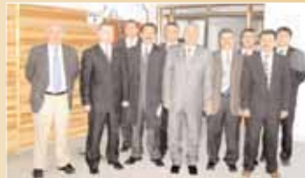
Kırıkkale Bayındırlık Müdürlüğü çalışanlarıyla