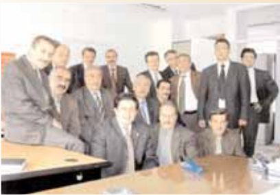
Kayseri Kocasinan kadaströ Müdürlüğü çalışanlarıyla