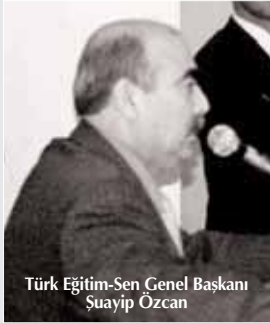
Türk Eğitim-Sen Genel Başkanı Şuayip Özcan