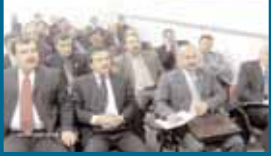
ANKARA GAR PERSONELİ