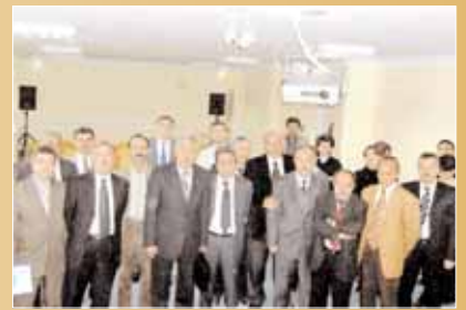
Kayseri İller Bankası Müdürlüğü çalışanlarıyla