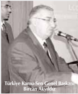
Türkiye Kamu-Sen Genel Başkanı Bircan Akyıldız

Savaş'ını anlatan sinevizyon gösterileri ve konuşmalarla yükselen heyecan dalgası, Mehteran Bölüğü'nün ve Kaya Kuzucu'nun konserleri ile zirveye çıktı.