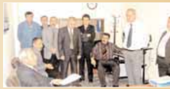
Kırşehir Kadaströ Müdürlüğü çalışanlarıyla