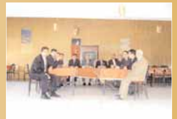
Sivas Bayındırlık Müdürlüğü çalışanlarıyla