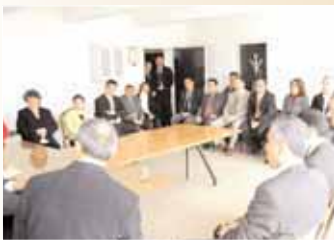
Kırşehir Bayındırlık Müdürlüğü çalışanlarıyla