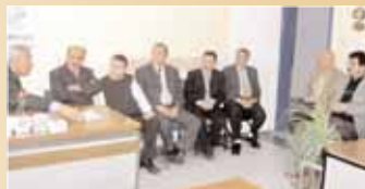
Kayseri Bayındırlık Müdürlüğü çalışanlarıyla